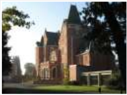
CRP Les Rhuets (41)