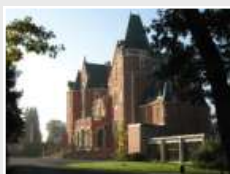
CRP Les Rhuets (45)