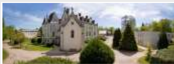
CRP La Mothe (03)