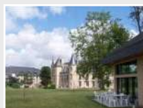
CRP Fontenailles ARPS (37)