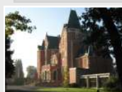
CRP Les Rhuets (41)