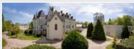
CRP La Mothe (03)