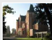
CRP Les Rhuets (41)