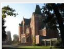
CRP Les Rhuets (41)