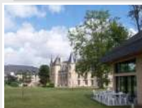
CRP Fontenailles (37)