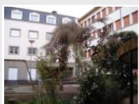
CRDV Clermont-Ferrand (63)