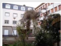
CRDV Clermont-Ferrand (63)